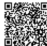
QR-Code zum Buch

Das Verfassen eines formal und inhaltlich korrekten und rechtlich einwandfreien Berichts in einer Notfallambulanz ist in diesem Buch an über 150 beispielhaften Berichten aus der Unfallchirurgie und Orthopädie sowie der Allgemein-, Viszeral-, Gefäß- und Thoraxchirurgie anschaulich dargestellt. Sowohl Berichte zur stationären Aufnahme wie auch solche zur ambulanten Weiterbehandlung haben Platz gefunden. Einführende Kapitel erläutern den systematischen Berichtsaufbau und die rechtlichen Hintergründe sowie fachspezifische Besonderheiten. Zudem bieten die Berichte durch ihre Realitätsnähe vor allem dem Chirurgen in der Weiterbildung die Möglichkeit, sich auf seine Tätigkeit in der Ambulanz vorzubereiten.